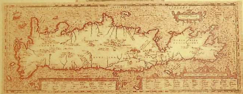
Βενετσιάνικος χάρτης του 1696