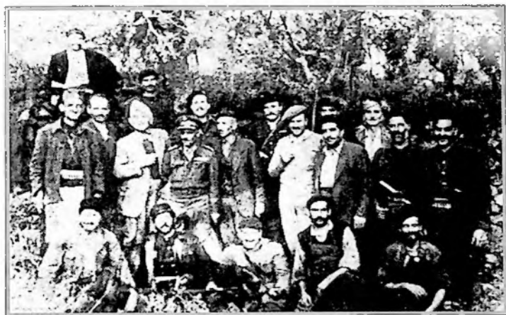
Ο στρατηγός Ν. Παπαδάκης, ο σμήναρχος Κελαϊδής και ο συνταγματάρχης Βαρδουλάκης, στο χωριό Παναγιά Κυδωνίας Χανίων, το 1944, ανάμεσα σε αντάρτες.

δυνάμεων για να προσφέρει ότι καλύτερο για την Πατρίδα και κατά την περίοδο που ήτανε στην κατεχόμενη Κρήτη, φαίνεται απ' ό,τι γράφουν γι' αυτόν οι προϊστάμενοί του: