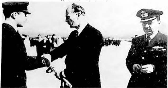
Ο υπουργός Εθν. Αμύνης Π. Κανελλόπουλος, παραδίδων τα ξίφη εις τους νέους ανθυποσημηναγούς της Σχολής Αεροπορίας.