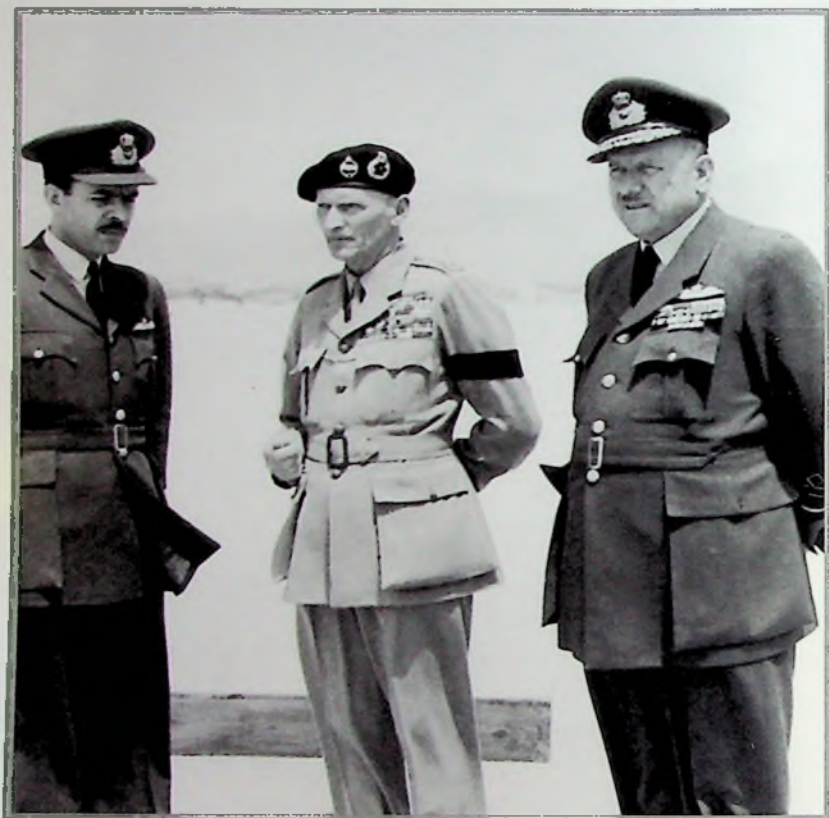
Με τον Στρατάρχη Μοντγκόμερη της Αγγλίας, στην αεροπορική Βάση της Ελευσίνας