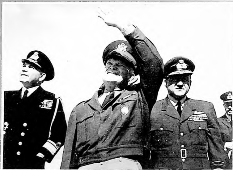
Με τον Στρατάρχη Αϊζενχάουερ (Αϊκ), μετέπειτα Πρόεδρο των Ηνωμένων Πολιτειών, Αρχιστράτηγο των Συμμοχθικών Δυνάμειν στην απόβαση της Νορμανδίας, κατά την επίσκεψή του στην Ελλάδα, ως Αρχηγός των στρατιωτικών δυνάμειν του ΝΑΤΟ