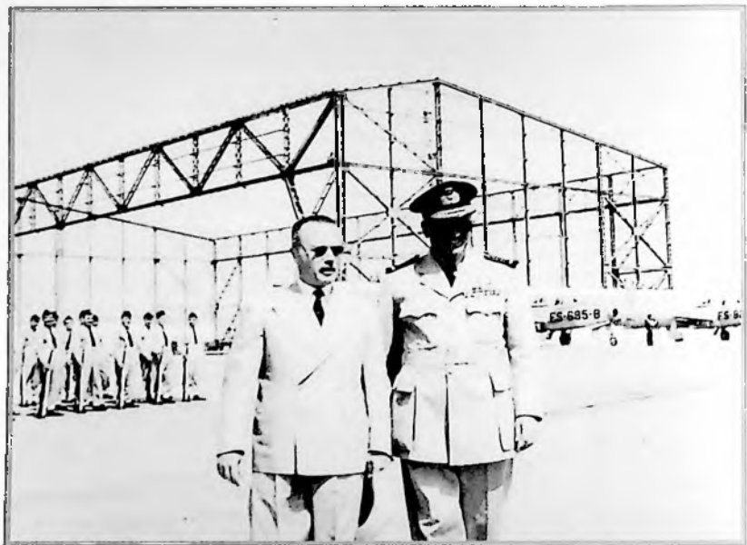
Με τον Σοφοκλή Βενιζέλο, στο αεροδρόμιο της Ελευσίνας, την περίοδο ανασυγκρότησης της Αεροπορίας και μετάπτωσής της από τα ελικοφόρα στα αεροθούμενα αεροσκάφη