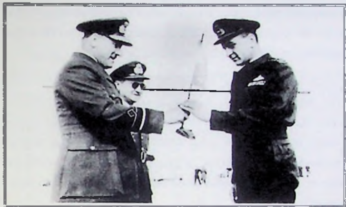
Ο Α/ΓΕΑ Υποπτέραρχος Εμ. Κελαϊδής παραδίδει τη σημαία κατά την αναχώρηση του 13ου Σμήνους για την Κορέα στον αρχηγό της αποστολής Επγό Ι. Χατζάκη