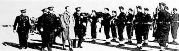
Ο Υπουργός Εθν. Αμύνης Κ. Καραμανλής, επιθεωρών τιμητικών απόσπασμα της Σχολής Αεροπορίας τον Οκτώβριον 1950