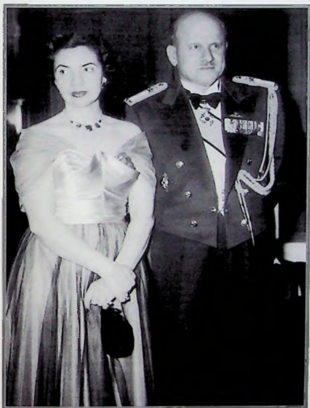
Η σύζυγος του Ευαγγελία, το γένος Αναγνωστάκη, καταγωγής από το Ρέθυμνο