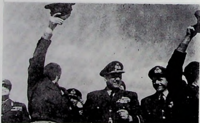
Παρακολούθηση σχηματισμού ιπταμένων προς τιμήν του Αρχιστράτηγου και δίπλα του Κελαϊδή ο μεθεπόμενος Αρχηγός Αεροπορίας Θεοδοσιάδης.