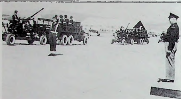
Παρέλαση τμημάτων της Αεροπορίας προ του Αρχιστράτηγου Αϊζενχάουερ στο αεροδρόμιο της Ελευσίνας