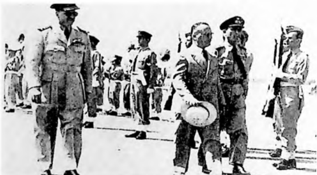
Ο υπουργός Εθνικής Αμύνης Σ. Βενιζέλος εις το αεροδρόμιον της Ελευσίνος το 1951.