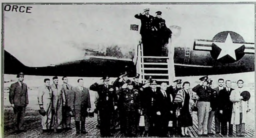
Υποδοχή του Αρχιστράτηγου του ΝΑΤΟ Στρατηγού Αϊζενχάουερ στο αεροδρόμιο του Ελληνικού. Από τον Υπουργό Εθνικής Αμύνης Σοφοκλή Βενιζέλου και τον Αρχηγό Αεροπορίας Εμμ. Κελαϊδή